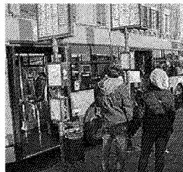
Una fermata degli autobus

Niente più bus in ritardo. O quasi. E se proprio lo saranno gli utenti lo sapranno in tempo reale: attraverso app e web: un sistema di geolocalizzazione di bordo potrà rilevare in ogni momento dove si trova il pullman, quando arriverà alla fermata, dove si può