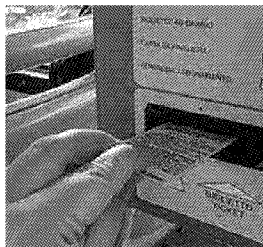
La macchinetta dei biglietti